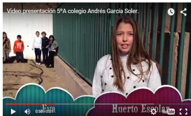
Clic en la imagen para ver Presentación de 6º Curso