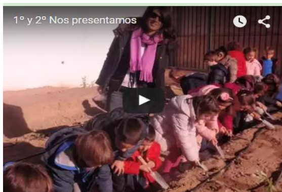
Clic en la imagen para ver Presentación de 5º Curso