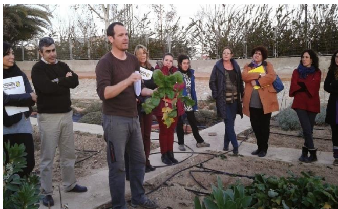
PREPARANDO SEMILLEROS PARA FUTUROS PLANTELES EN LA UNIVERSIDAD