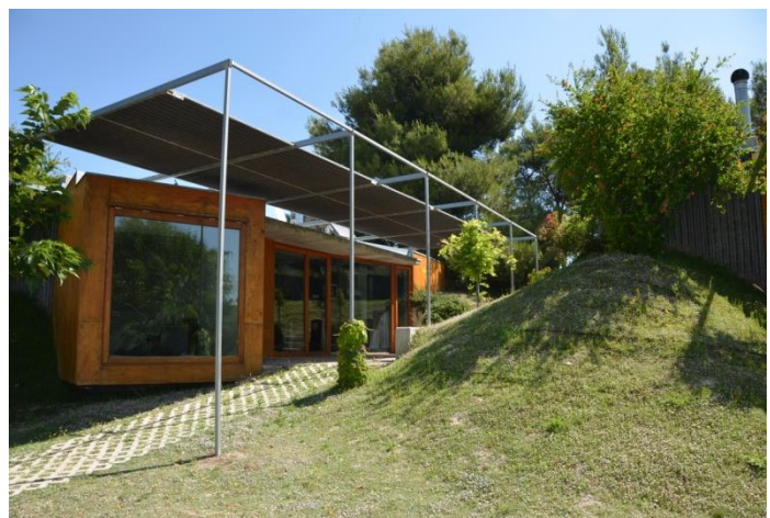
JORNADA EN EL CEAMA, CON VISITA AL HUERTO, TALLERES Y CHARLAS